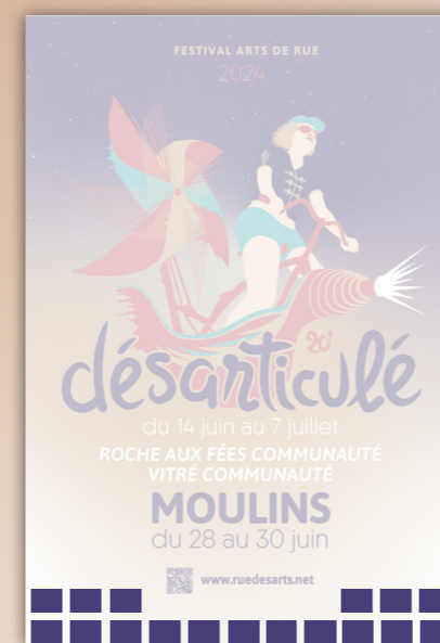
Affiche du festival (Formats : 40x60 - A3 - A4)