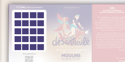
Programme du festival